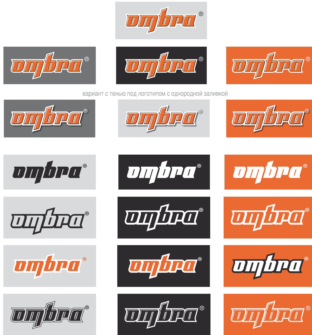
вариант с тенью под логотипом с однородной заливкой